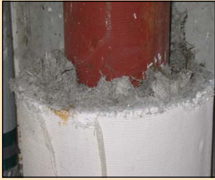
Peluches dégradées après découpe du calorifuge dans une gaine technique d'un service du CHU