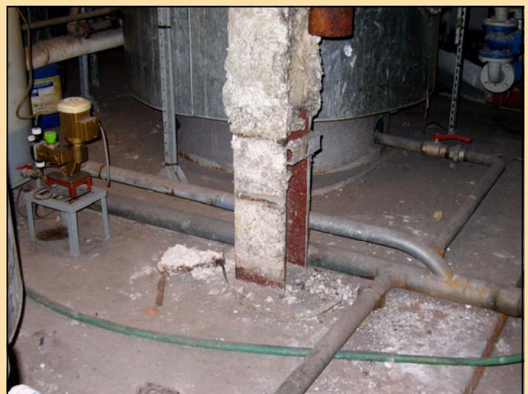
Les chocs répétés contre un pilier ont fait tomber des morceaux du flocage qui l'entourait