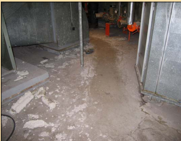
Les passages des techniciens de maintenance ont tracé des chemins comme dans la neige

l'hôpital enverrait à tous les étages les fibres cancérogènes.