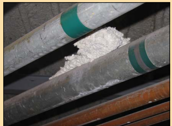
Un fragment du flocage tombé du plafond reste coincé entre deux tuyaux.