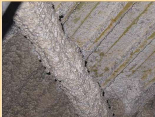
Le flocage du plafond se décolle par pans entiers

Qui plus est, Serge Vautier affirme que le système de désenfumage de