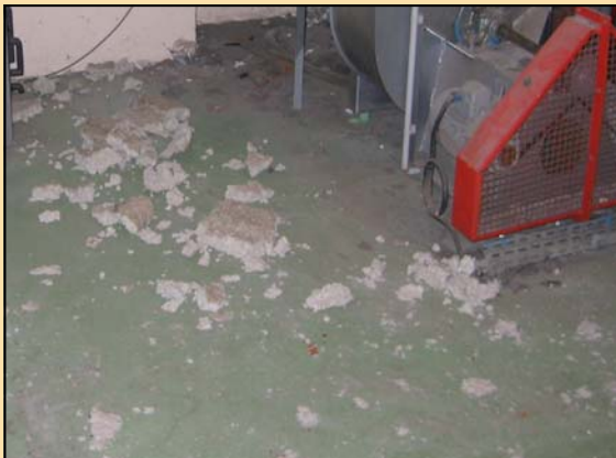
Débris d'amiante tombés sur le sol