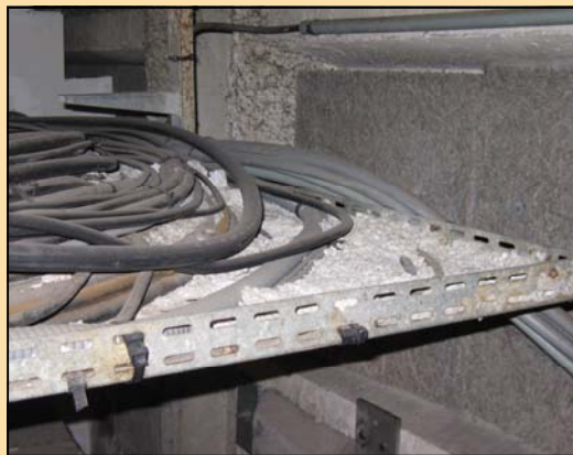
Pluie de morceaux d'amiante sur un chemin de câbles